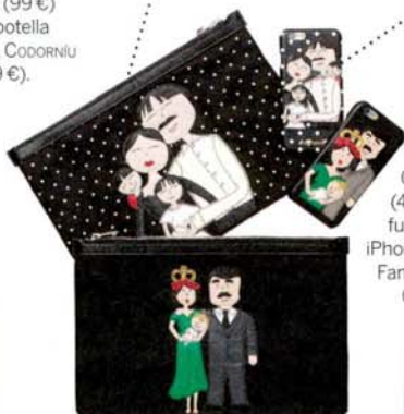
Carteras (495 €/u) y fundas para iPhone (325 €/u) Family DOLCE & GABBANA.