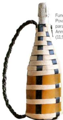
Funda MIRIAM PONSÁ (99 €) para botella Anna, CODORNÍU (11.99 €).

Si te apasiona diferenciarte y ser el blanco de todas las miradas, apunta nuestras propuestas. ¡Serás la reina del baile!