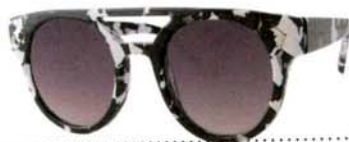
Gafas de sol DAVIDELFIN PARA ÓPTICALIA (109.90 €).