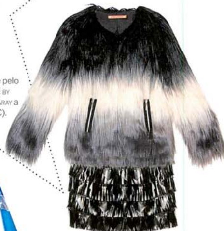
Abrigo de pelo ecopiell by GIMENA GARAY a (395 €).