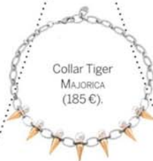
Collar Tiger MAJORICA (185 €).