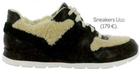
Sneakers Ugg (179 €).