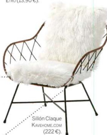
Sillón Claque KAVEHOME.COM (222 €).