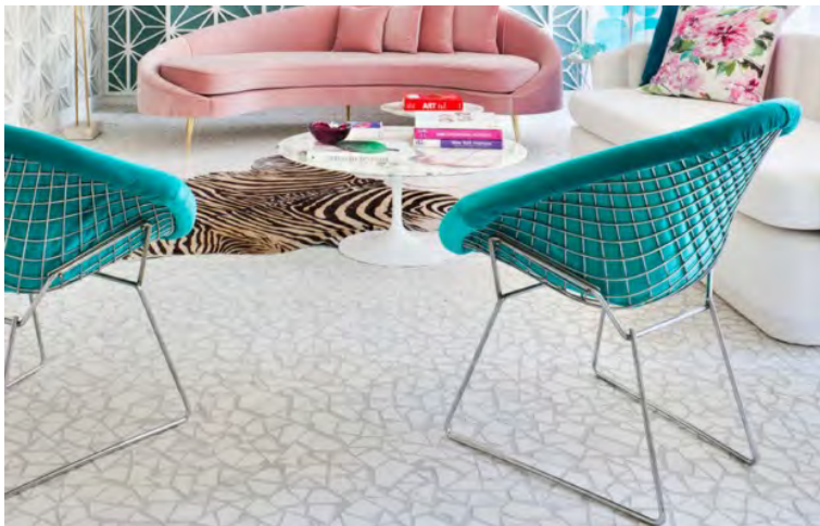
Espacio Westwing, La Caja Mágica, de Miriam Alía