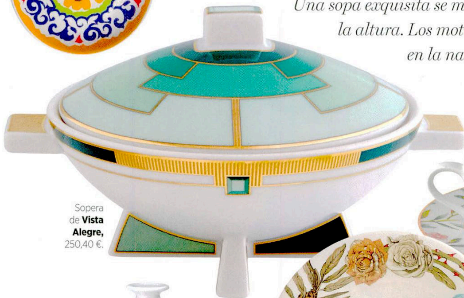
Sopera de Vista Alegre , 250,40 €.