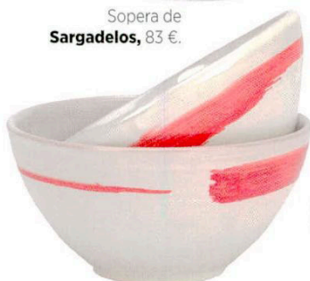
Bol de A Casa Bianca , 12 €.