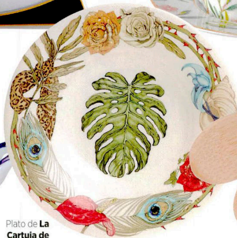
Plato de La Cartuja de Sevilla , 24,95 €.