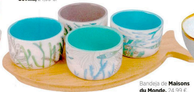
Bandeja de Maisons du Monde , 24,99 €.