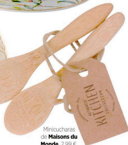
Minicucharas de Maisons du Monde , 2,99 €.