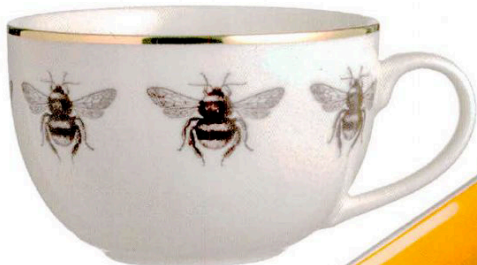
Taza de H&M , 7,99 €.