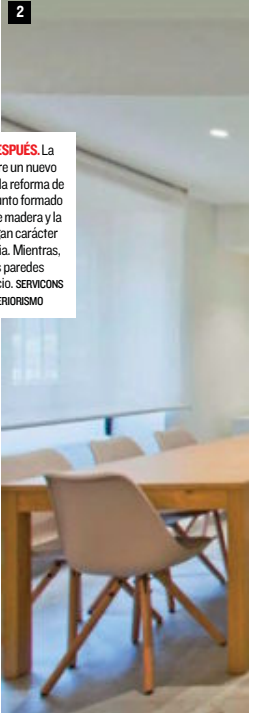
1 Y 2. ANTES Y DESPUÉS. La chimenea adquiere un nuevo protagonismo tras la reforma de este salón. El conjunto formado con los muebles de madera y la viga de forja otorgan carácter rústico a la estancia. Mientras, el blanco de las paredes moderniza el espacio. SERVICIOS REFORMAS & INTERIORISMO

➔ Estadística (INE), en 2017 había en España 17.596 viviendas rurales con capacidad para más de 172.000 turistas, lo que se traduce en una media de unas 10 plazas por alojamiento que dan trabajo a 27.400 personas. Por comunidades, Castilla y León, concentra, con 3.710 alojamientos, la mayor cantidad.