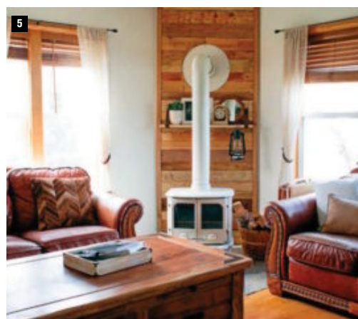
3. BAÑO. La recuperación de elementos antiguos, el color azul de las paredes y el uso de contraventanas restauradas como elementos decorativos ayudan a crear una atmósfera de relajación. 4. EXTERIOR. La pared revestida en piedra y la proliferación de plantas contribuyen a dotar de un aire rústico a esta vivienda de nueva construcción. 5. SALÓN. La combinación de madera en varios elementos y los sofás de piel aportan calidez a esta estancia. Asimismo, la chimenea de estilo 'vintage' ayuda a reforzar esta sensación. HOZZ

incendios, accesibilidad, abastecimiento de aguas y saneamiento.