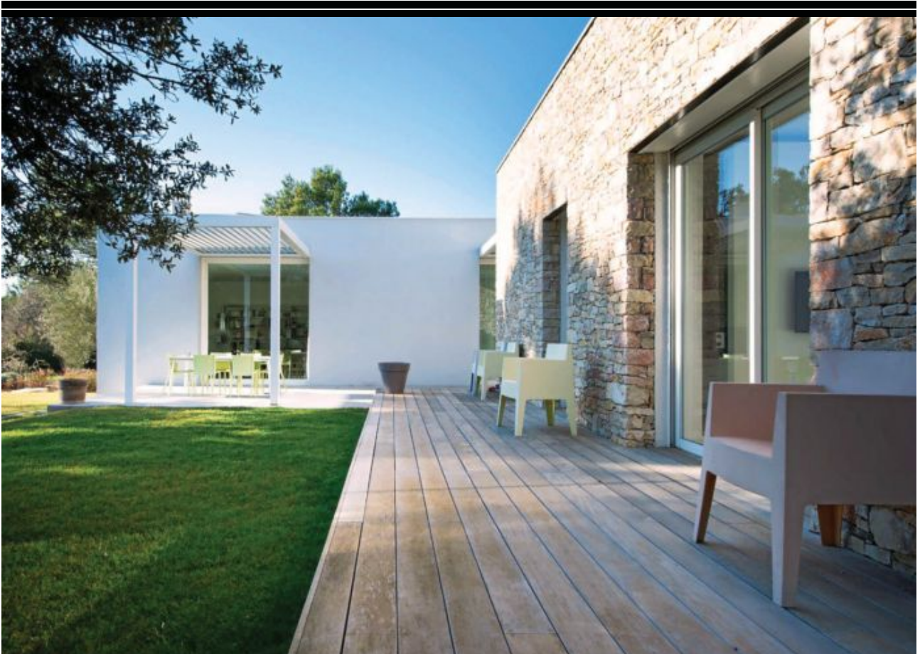
ESTILO RÚSTICO 'CHIC': Las 'nuevas' casas rurales juegan a mezclar elementos tradicionales, como madera y piedra, con un diseño contemporáneo.

TURISMO: ¿QUIERE ABRIR UNA CASA RURAL? SIGA ESTOS PASOS →