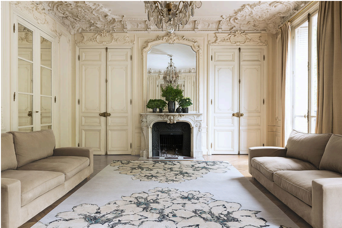
lfombra In bloom de Elie Saab para The Rug Company

Al igual que en moda, las francesas representan ese chic inspirador que tanto nos gusta, que fusiona sin dificultad elegancia a la vez que naturalidad y sencillez, también en decoración el país vecino hace alarde de una sutileza muy inspiradora.