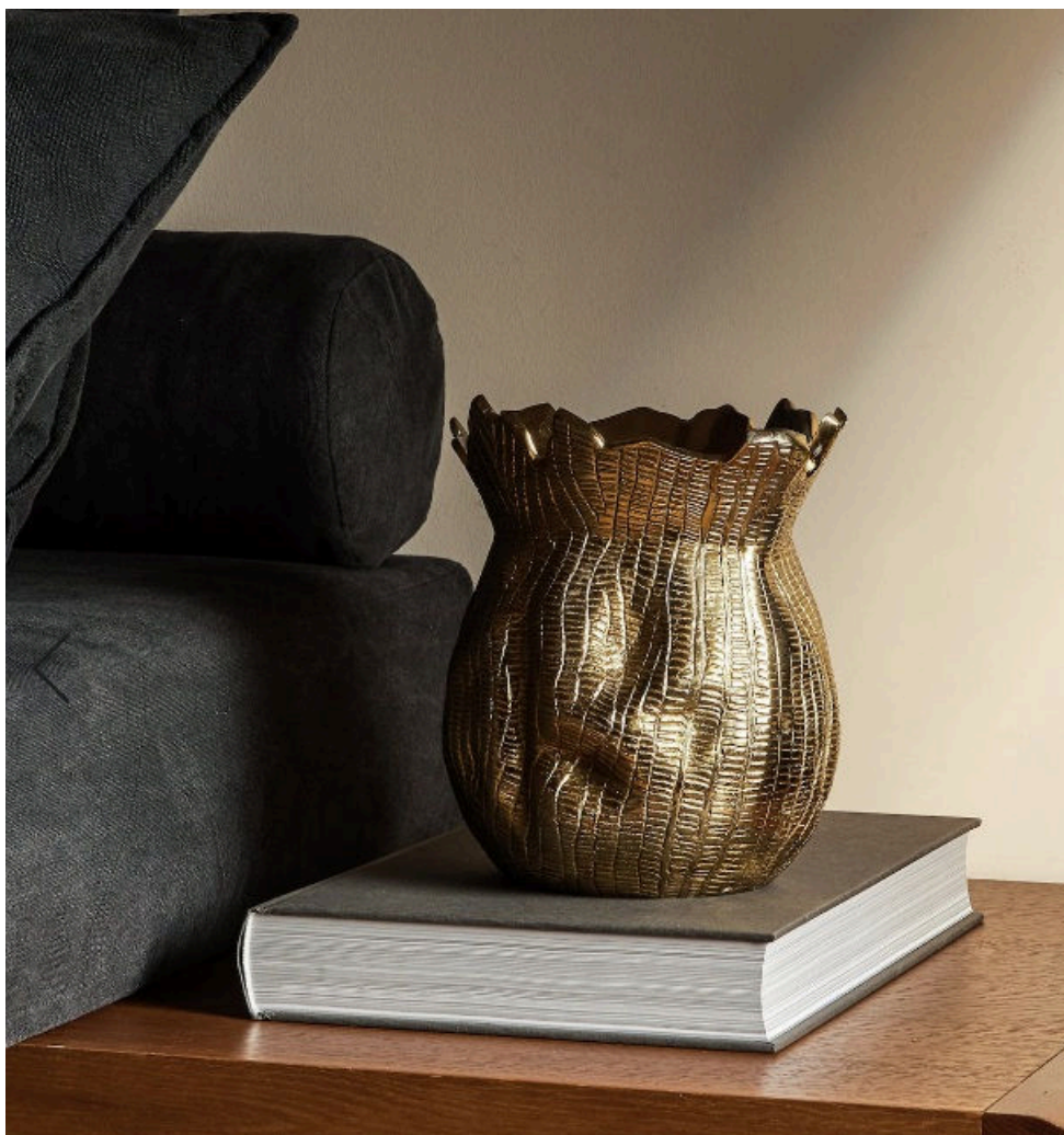
Jarrón dorado con acabado envejecido. 39,99 euros en Zara Home.

El típico apartamento parisino suele tener techos muy altos, puertas dobles, suelos de madera y chimeneas. "Exquisitas molduras y artesanados adornan los techos que, junto a las contraventanas, las puertas altas y las paredes forradas con toile de jouty forman un conjunto en el que los toques dorados adquieren gran protagonismo" , resaltan.