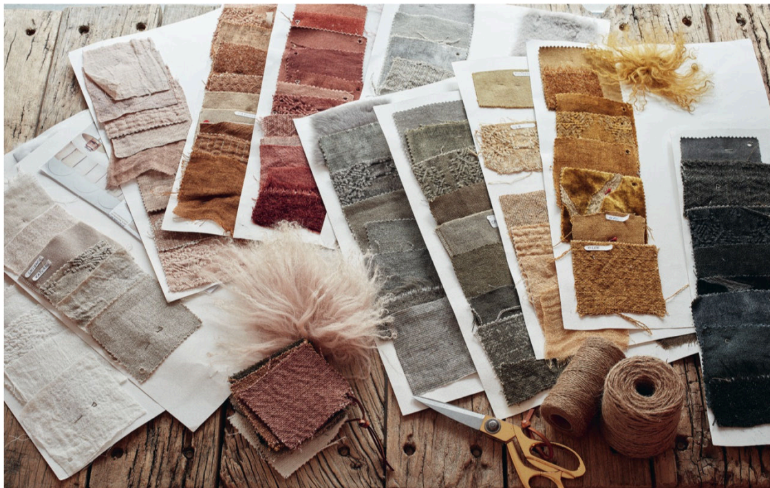
Línea textil de Maison de Vacances.

Aunque nuestra casa se encuentre a varios kilómetros de la capital de la moda, podemos conseguir plasmar este estilo ayudándonos de diferentes elementos, como el color: "Nuestro Pantone de colores va desde los naturales de los linos, pasando por los tonos soft de los algodones, hasta el celadon y el royal de los terciopelos" , recomiendan desde este referente madrileño en decoración y apuntan: "No te olvides de alguna piel o charol negro (si es de "las pulgas" mejor) y algún rincón con flor natural en colores vivos" .