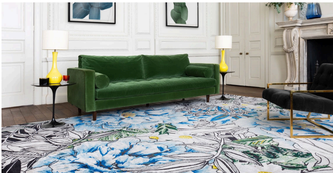
Alfombra diseñada por María Katrantzou para The Rug Company.

En busca del chic francés, la decoración que propone Indietro "se apoya en suelos que