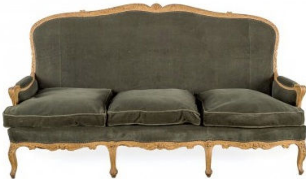
Sillón de estilo Isabelino a la venta en Durán (427 euros).

"Por último, piensa en darle una oportunidad a esas piezas que puedes heredar, como algun tapiz o una cama con dosel, que con un retapizado y pintado, que aportarán un toque bohemio", apuntan desde Indietro.