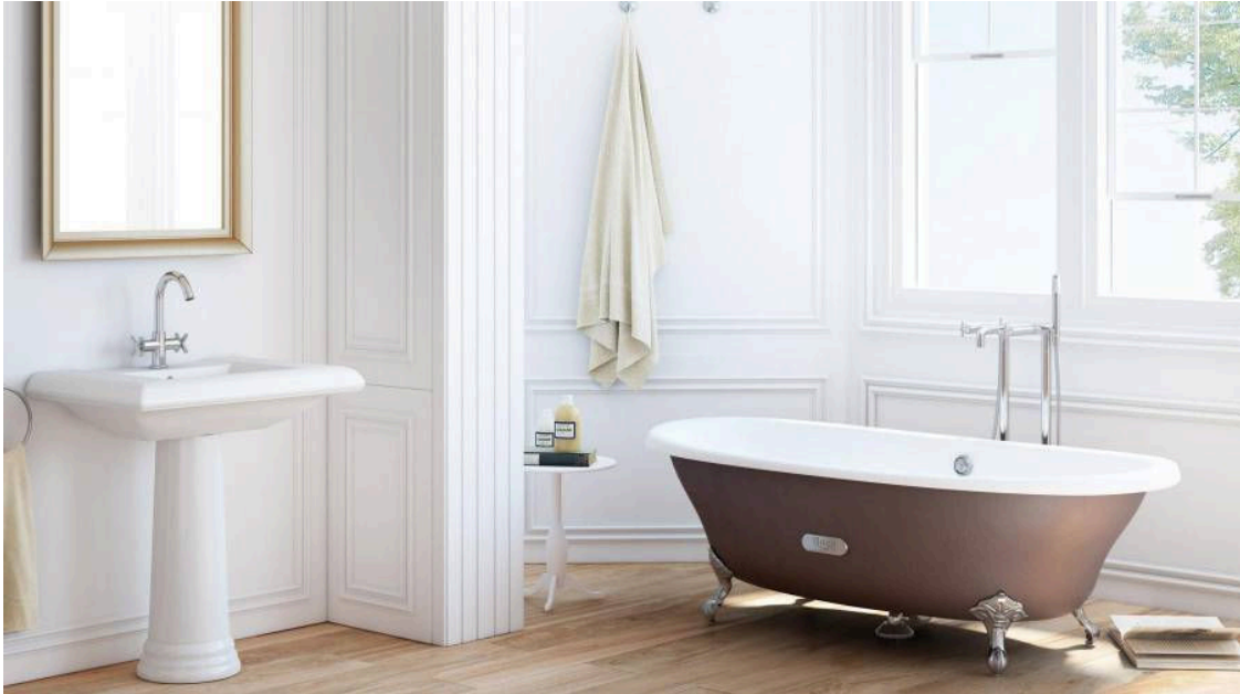
Bañera clásica Newcastle de Roca.

Como en todos los estilos, el trés chic parisino posee determinadas piezas indispensables: una lámpara chandelier , una chaise longue , una chimenea mármol, una bañera exenta, boiseries , una butaca Luis XV y un sofá capitoné . Juntos conseguirán un hogar que derroche ese aire bohemio tan especial que buscamos.