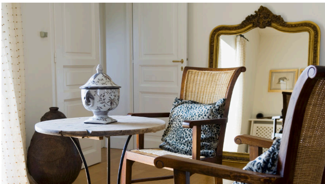
Propuesta de Westwing con distintos estilos y estampados.