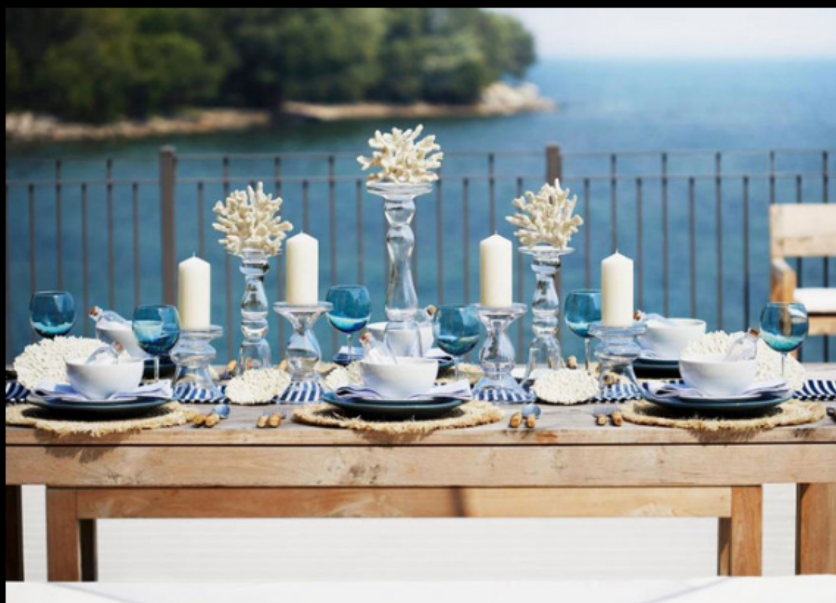
Imagen 1 de 3

Si estás pensando en renovar tu casa estás de suerte. Westwing, el primer club de decoración de ventas privadas online , ha llegado a España. Para "decoadictas".