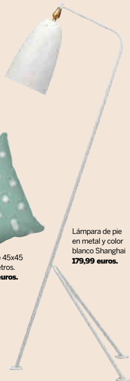
Lámpara de pie en metal y color blanco Shanghai 179,99 euros.