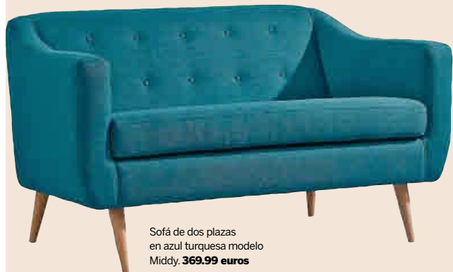
Sofá de dos plazas en azul turquesa modelo Middy. 369.99 euros