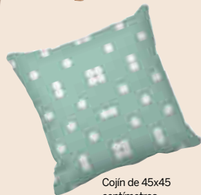
Cojín de 45x45 centímetros. 33,99 euros.