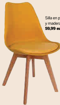
Silla en polietileno y madera de haya. 59,99 euros.