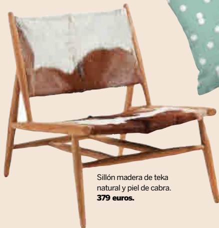
Sillón madera de teka natural y piel de cabra. 379 euros.