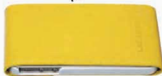
LACAMBRA. Funda para iPhone. Precio: 29 €. mylacambra.com