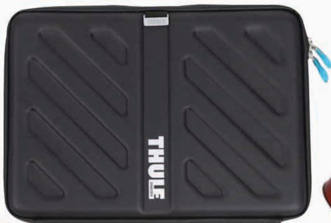
THULE. Funda para MacBook. Precio: 49 €. www.k-tuin.com