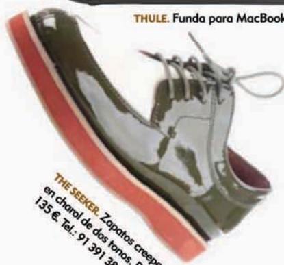
THE SEEKER. Zapatos creepers en charol de dos tonos. Precio: 135 €. Tel.: 91 391 38 22.