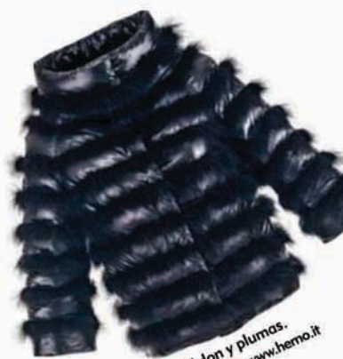
HERNO. Nylon y plumas. Precio: 1.005 €. www.herno.it