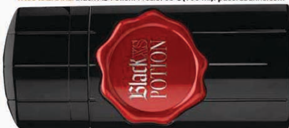
PACO RABANNE. Black XS Potion. Precio: 63 € (100 ml). pacorabanne.com