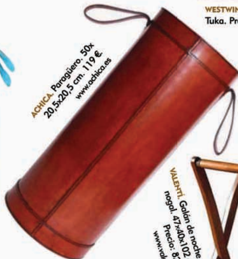
ACHICA. Paragüero 50x20,5x20,5 cm. 119 €. www.achicas.es