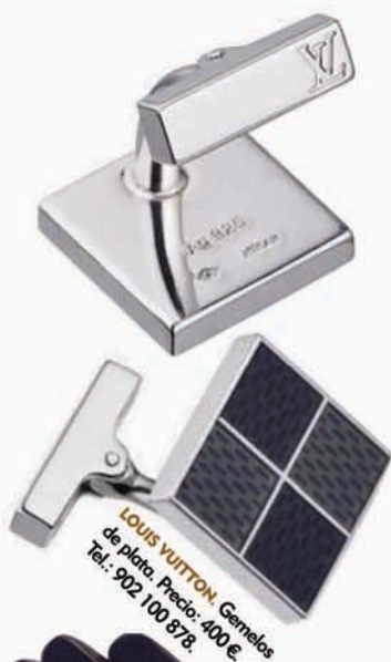
LOUIS VUITTON. Gemelos de plata. Precio: 400 €. Tel.: 902 100 878.