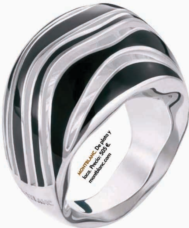
MONTBLANC. De plata y laca. Precio: 505 €. montblanc.com