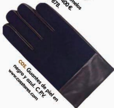
CO5. Guantes de piel en negro y azul. C.P.Y. www.casstores.com